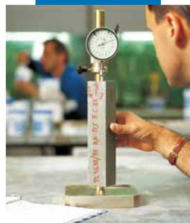
Badanie skurczu w fazie twardnienia zgodnie z normą UNI 8147