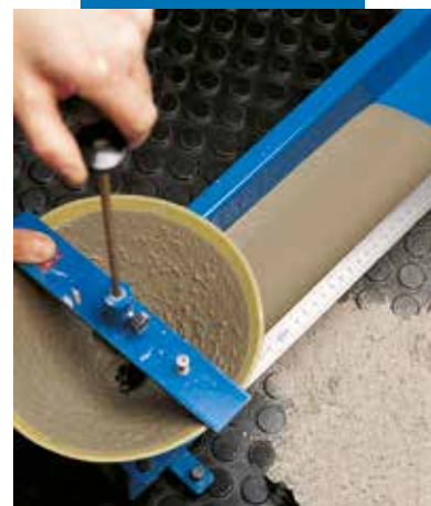
Badanie płynności po wymieszaniu zgodnie z EN 13395-2