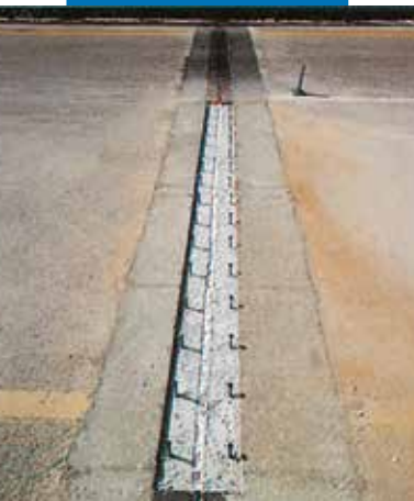
Naprawa sztywnych złączy mostu na autostradzie z użyciem Mapecifill