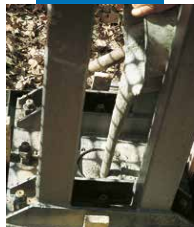
Kotwienie z użyciem Mapefill

Referencje dotyczące produktu są dostępne na życzenie oraz na stronach www.mapei.com i www.mapei.pl