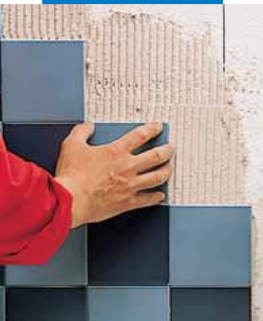
Montaż płytek na płyty styropianowe