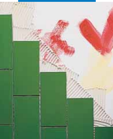
Montaż płytek na ściany malowane