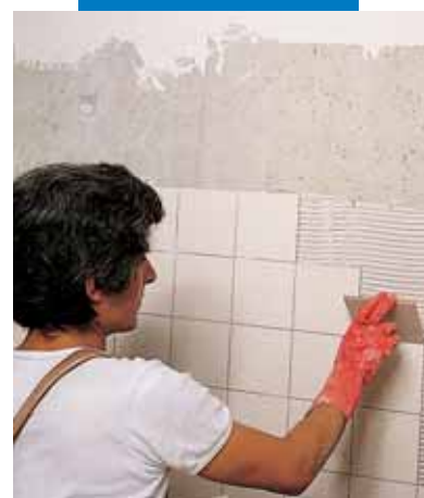
Montaż płytek na ścianie betonowej