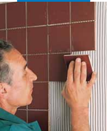
Montaż płytek na ścianie gipsowej