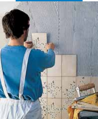
Montaż płytek na ścianie z tradycyjnym tynkiem

Świeże podłoża cementowe powinny być odpowiednio wysezonowane (tzn. powinny schnąć przez przynajmniej tydzień na każdy 1 cm grubości).