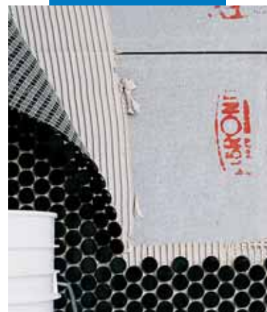
Montaż mozaiki na fibrobetonie