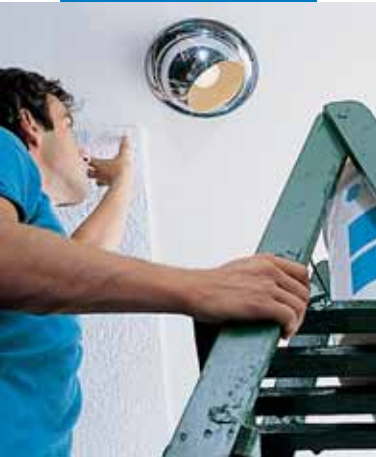
Montaż płyt styropianowych na suficie