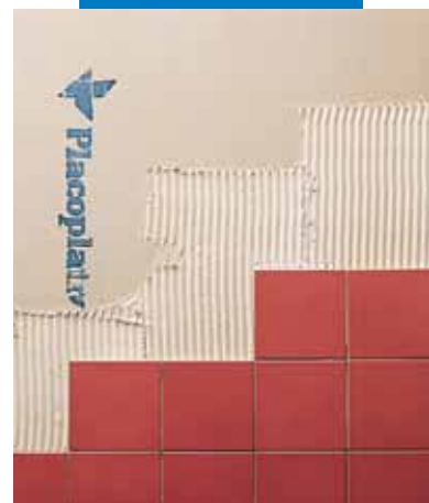
Montaż płytek na ścianie z płyty kartonowo-gipsowej